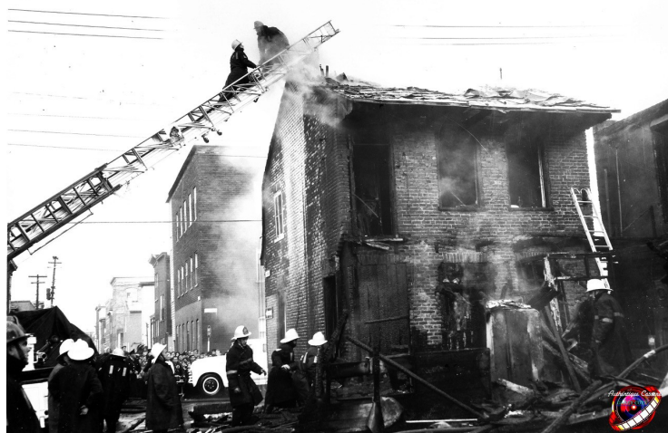
( Le Soleil, 08 Décembre 1965, page 17 )

Les pompiers de 10 casernes étaient sous les ordres du Chef de la Brigade, M. J-B Voiselle qui était assisté du Chef-adjoint M. H. Auclair et de plusieurs autres officiers.