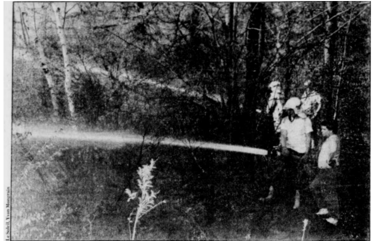
Plus de 80 pompiers ont combattu l'incendie derrière le CRIQ.

Écrit par Garey Côté pour Authentique Caserne. Le Soleil du 23 mai 1992 section C-12.