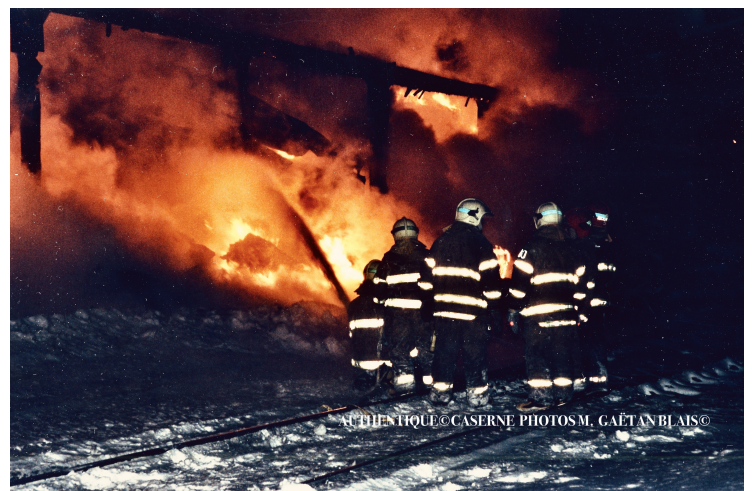
Authentique Caserne

(Soleil, 14 Janvier 1999, cahier A, page 4)